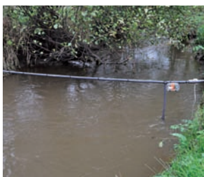
(G-D) Antennes en cours d'installation sur la Frome (photos 1 et 2) et antenne installé sur la rivière Oir (photo 3).