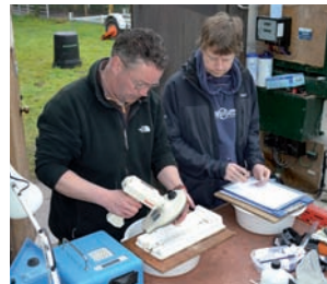
(L-R) Salmon parr are weighed, measured and PIT tagged; 10,000 salmon parr are electro-fished on the River Frome; Smolts are monitored in spring before heading out to sea.