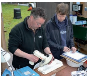
(G-D) Les tacons sont pesés, mesurés et équipés de marques individuelles PIT; 10 000 tacons sont pêchés à l'électricité sur la rivière Frome; les smolts sont suivis au printemps avant de partir en mer.