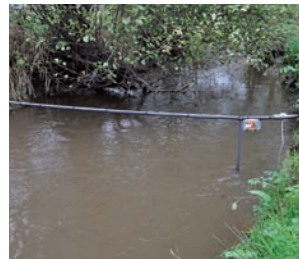
(L-R) PIT tag readers being installed on the River Frome and flat-bed antenna being installed at the salmon counter; PIT tag kit installed on the River Oir.