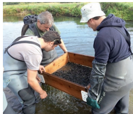
Le personnel de l'INRA démontrant à l'équipe britannique la méthode qu'il utilise pour le suivi des lamproies.

Au mois d'août, nos partenaires de l'INRA se sont rendus sur la Frome pour tester la transférabilité de leur technique de suivi de la lamproie et ils l'ont comparée à la technique britannique basée sur la pêche électrique.